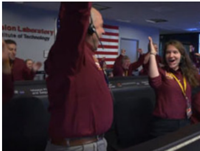
Pasadena, Touch down !