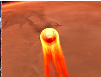
Mars, Elysium plain