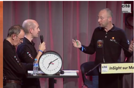
Paris, cité de la Science

1067 sols après (et 30 newsletters après !), Insight, à l'écoute de Mars, a commencé à décrypter quelques secrets de la planète rouge. Quelques marsquakes remarquables auront permis de mieux affiner la connaissance de la structure interne de Mars du noyau à la croûte.